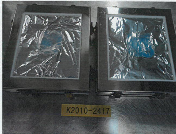
〈 챔버 장착 전 〉