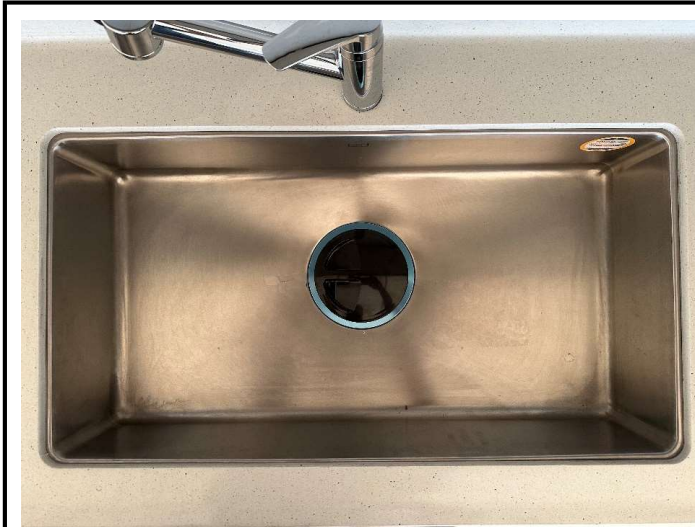
싱크볼 배수구 뚜껑 덮은 상태