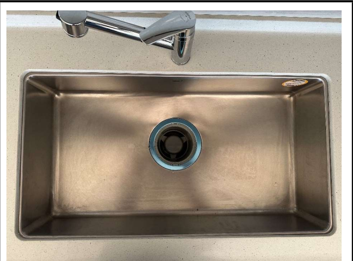
싱크볼 배수구 뚜껑 및 거름망 제거 상태