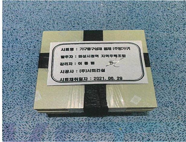
〈 시료 봉인 사진 〉