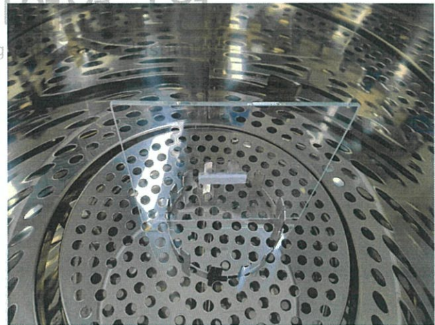
< 챔버 장착 후 -2 >