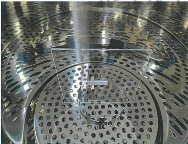
< 챔버 장착 후 -1 >