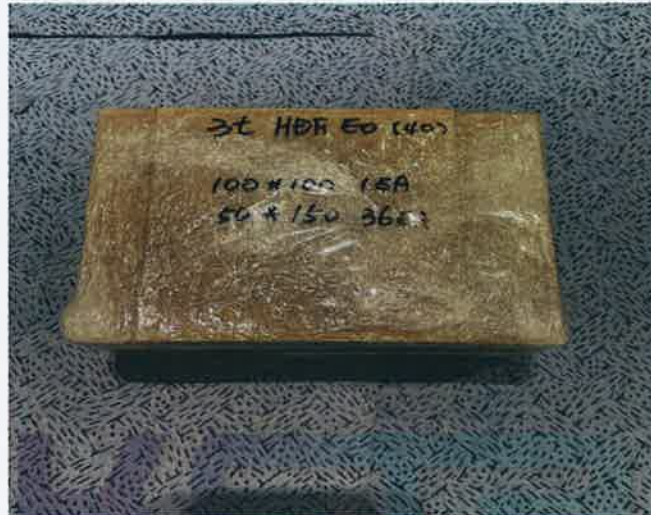
< 가정용 싱크대(모델 NO : NF-S2101)_고밀도 섬유판(HDF) 3T >

한국가구시험연구원 Korea Furniture Testing & Research Institute