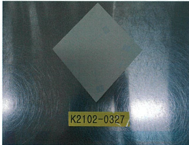
< 챔버 장착 전 >