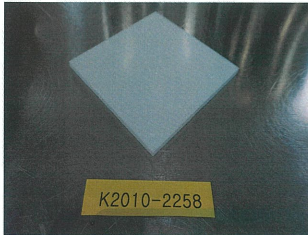
< 챔버 장착 전 >