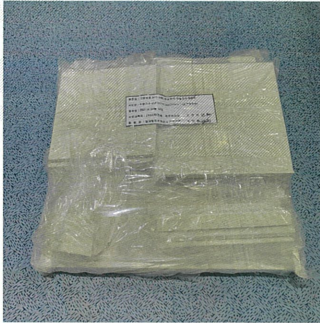
인조대리석(BMC) 7 mm