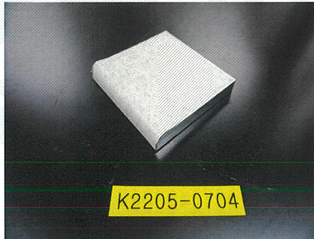
〈 챔버 장착 전 〉