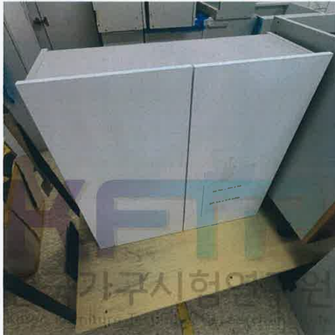
상부장 800 mm