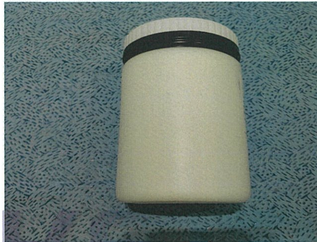
〈 HPL부착용 〉

한국가구시험연구원 Korea Furniture Testing & Research Institute