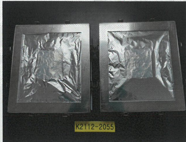
〈 챔버 장착 전 〉