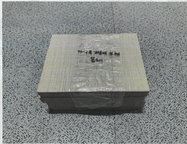
< 시료 봉인 사진 >