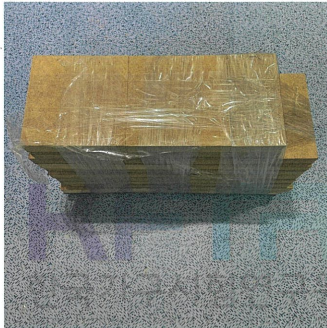
증밀도 섬유판(MDF) 18 mm