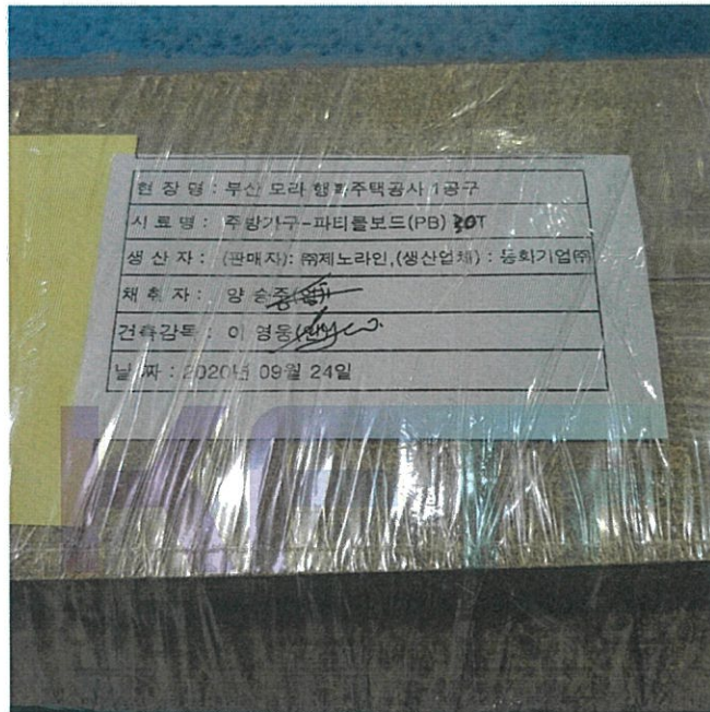
파티클보드(PB) 30 mm