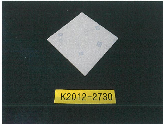
< 챔버 장착 전 >